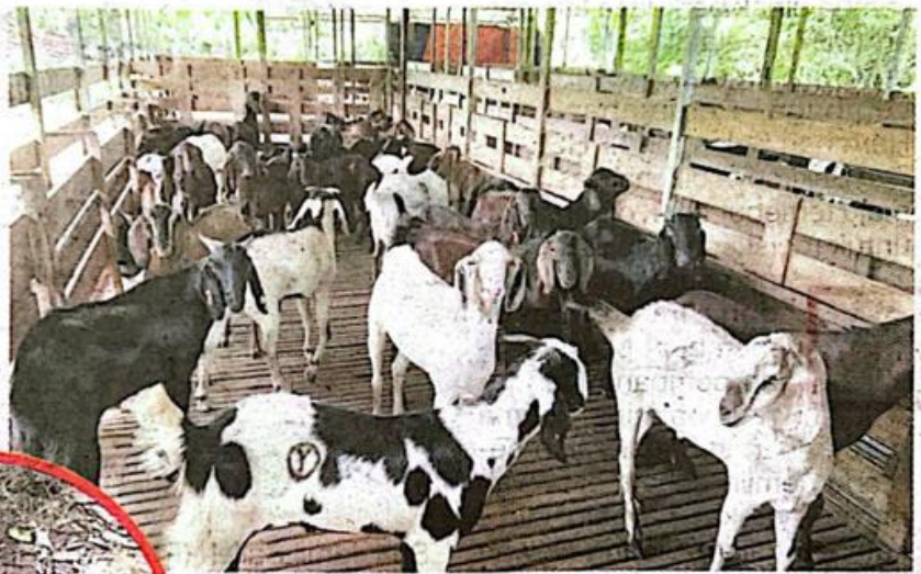
Kandang kambing milik Noor Akma sering menjadi sasaran pencuri setiap kali menjelang perayaan.

nyembelih sembilan ekor kambing di kawasan kandang itu.