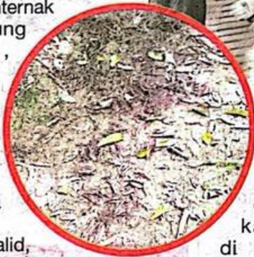
Kesan darah di kawasan kandang kambing.

"Semasa kiraan dilakukan semuanya 10 ekor kambing telah terlepas. Pencuri berkecimpung me-